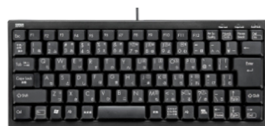
A-2) キーボード SKB-KG3BKN