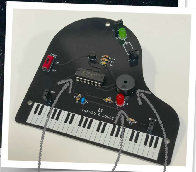
音に合わせて光るLED