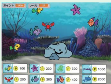
マイアクアリウム

キーボードでポイントを貯めて魚を増やすゲームです。「変数」機能を使い、レベルや魚の数などを管理しています。