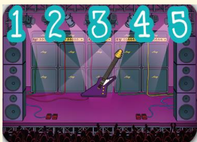
キーボードで操作できるギターを作ろう

「音」ブロックを中心に扱います。旗を押して曲を流したり、キーを押して好きな音を出せるようにすることでScratchのプログラミングの基礎を学びます。