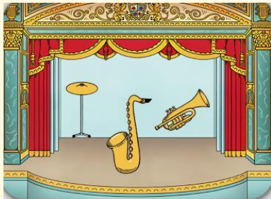
プログラミングで作曲しよう