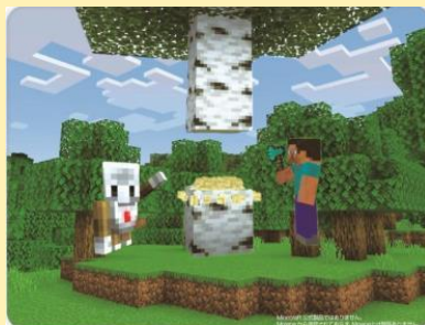
プログラミングでらくらくもくざいあつめ！

Scratch回ではプログラミングの基礎「分岐」を中心に扱います。分岐を使ってオリジナルパスワード判定を作っていきます