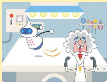
ポンコツロボットにはんていさせよ！

Scratch回ではプログラミングの基礎「分岐」を中心に扱います。分岐を使ってオリジナルパスワード判定を作っていきます