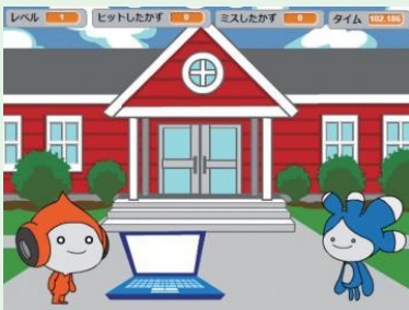
タイピングゲーム

キーボードで相手が行ってくるお題の文字を入力するタイピングゲーム。「メッセージ」機能を使い、お題の管理を行います。