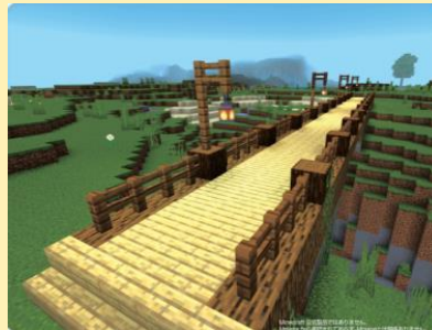
「橋」をかけて谷を越えよう！

Scratch回ではプログラミングの基礎「繰り返し」を中心に扱います。繰り返しを使ってロボットがお絵描きしながらコイン探しを行います。