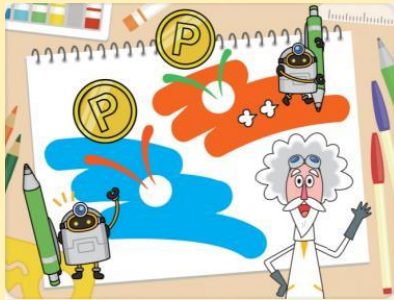
ポンコツロボットとコイン探しとお絵描き！

Scratch回ではプログラミングの基礎「繰り返し」を中心に扱います。繰り返しを使ってロボットがお絵描きしながらコイン探しを行います。