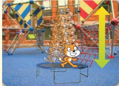
トランポリンでぴよんぴよんジャンプ

「制御」ブロックを中心に扱います。分岐と繰り返しを使い、ジャンプのアニメーションを作成、連続ジャンプをさせたりしてScratchのプログラミングの基礎を学びます。